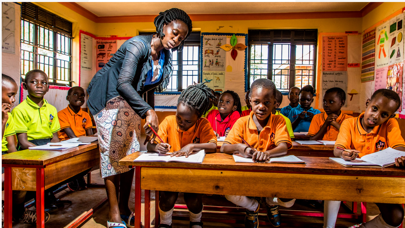
Solar Now - Ouganda