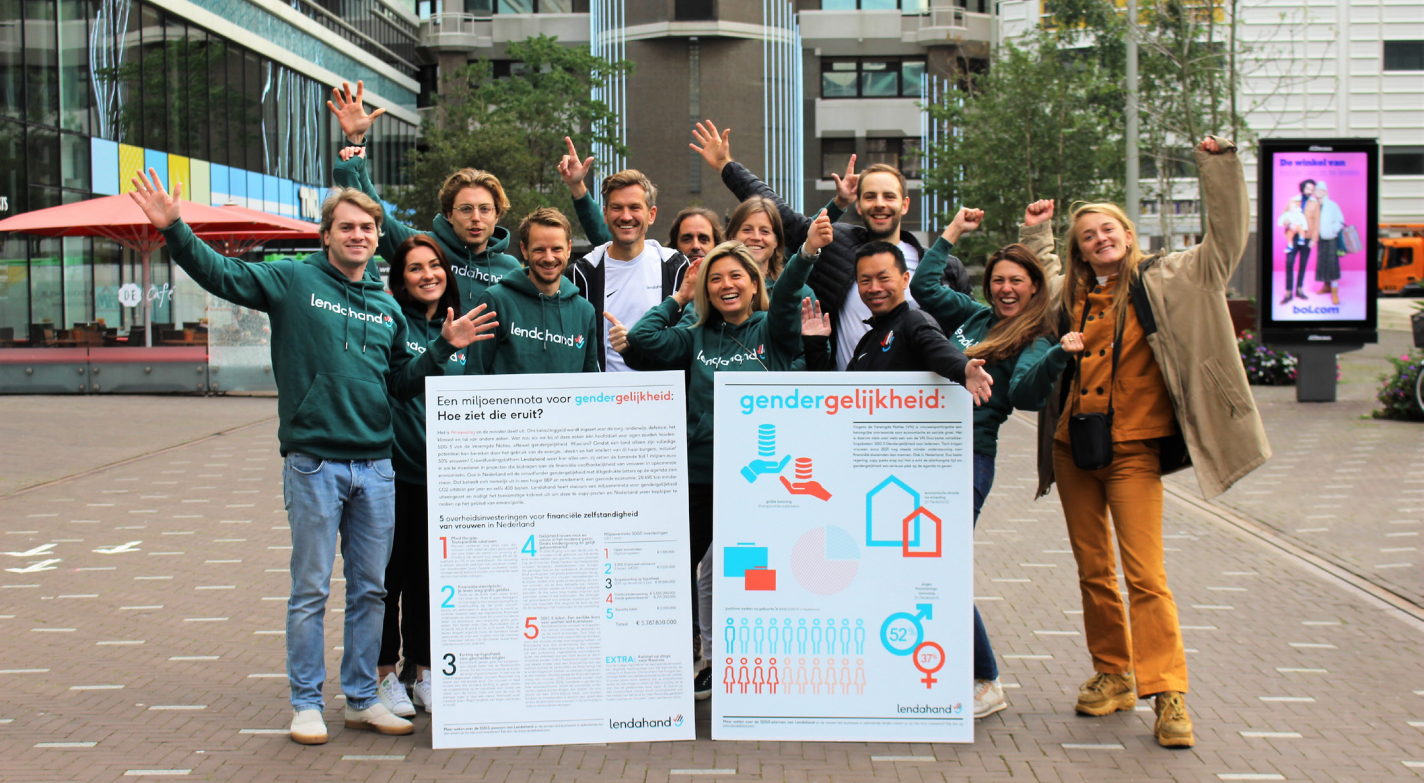
Lendahand - Pays-Bas