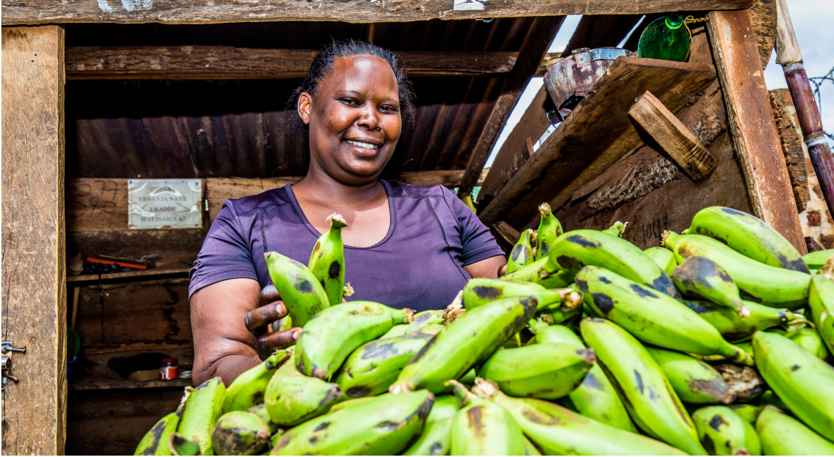
Opportunity Bank - Ouganda