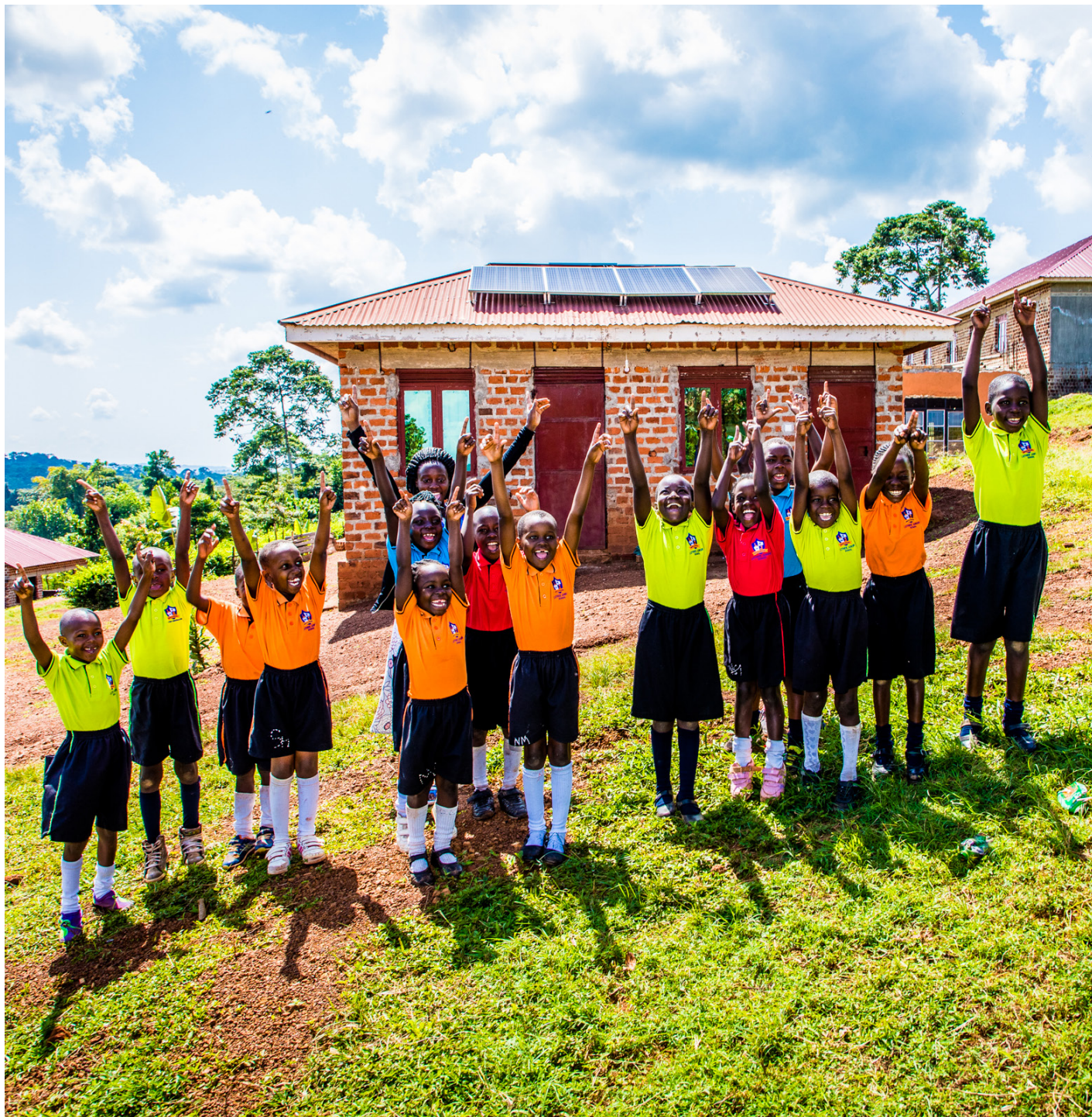
SolarNow - Ouganda