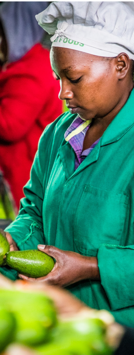
FACTS - Kenya